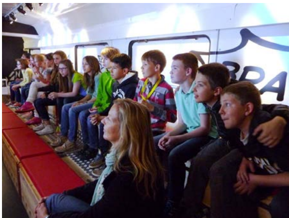
Lernen im SBB Schulzug