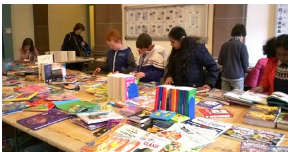
Grosses Interesse beim Bücherverkauf von Summersbook

Wohnung zu vermieten ab 01. Juli 2014: Geräumige und sehr helle Wohnung an der Gartenstrasse zu vermieten, Nähe Aeschenplatz und SBB. Die Wohnung hat 3 Schlafzimmer, 2 grosse Wohnräume, Küche, 2 Bäder. Sie hat auch einen schönen Balkon der auf einen Grünbereich schaut, ideal für Frühstück und zum Grillen. Preis: CHF 3.000 pro Monat + Nebenkosten. Bei Interesse ruft an unter: 076 765 80 05.