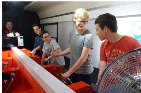
Es ist anstrengend Popcorn „per Hand“ herzustellen