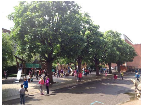
Das Frühlingwetter hatte einige Höhen und Tiefen, aber die Schüler wissen wie man das Beste aus den Pausen macht

Haus zu vermieten: Schönes Haus mit Blick über Baselland und Umgebung. 300m 2 , mit 5-7 Schlafzimmern, 2.5 Badezimmern, Garage für 2 Autos sowie 2 Stellplätzen. Moderne Küche mit American Food Center Kühlschrank und grossem Ofen. Geothermisch betriebene Fussbodenheizung, Wärmepumpe und Swimmingpool. Kamin mit Wärmespeicher. Schöner Garten mit direktem Zugang zu Wanderwegen. Verfügbar ab 1. August. Kontakt: sparehinsh@gmail.com .