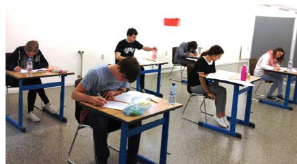
IB Schüler haben eine intensive Phase im April & Mai: die Abschlussklausuren. Bald habt ihr es geschafft!

http://www.swissinternationalschool.ch/de-CH/Schulstandorte/Basel/Allgemeine-Infos/Video-SIS-Basel